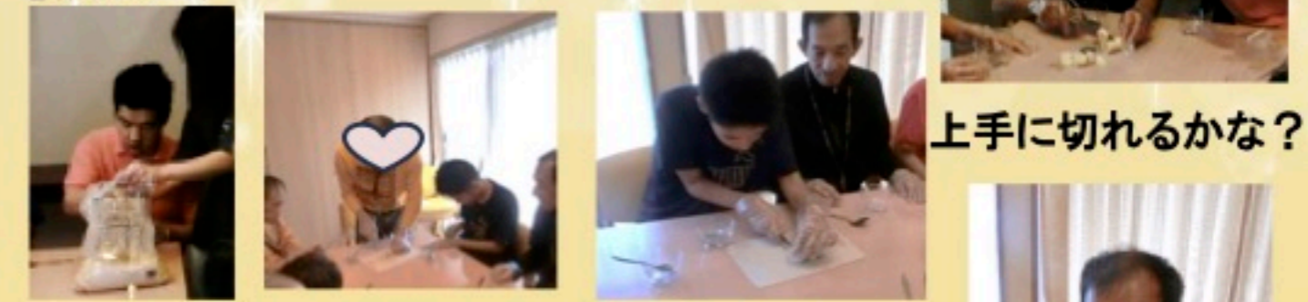
上手に切れるかな?