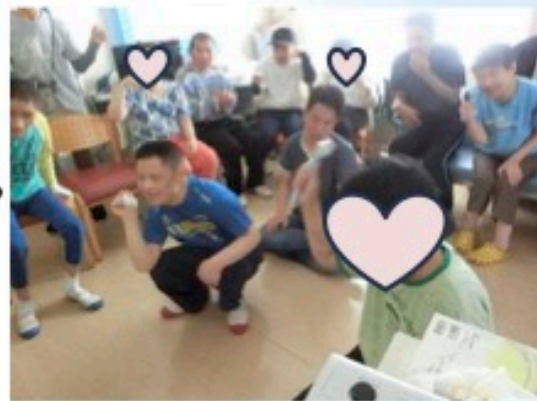
歯ブラシごしごし