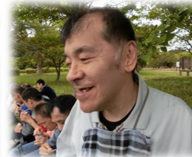
自然に癒されます♡