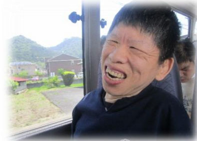
5丁目ご利用者も一緒に♪