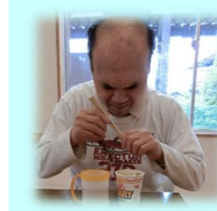
温かいうちに頂きます

5月28日に余暇の充実のため、おやつとしてカップ麺を提供し召し上がっていただきました。5種類のカップ麺から好みの物を選ばれ、美味しく召し上がられていました。