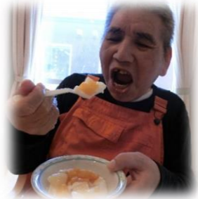
自分で作ったおやつは美味しいな