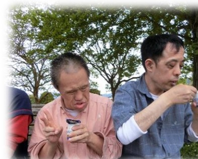
外で食べるおやつは最高！！