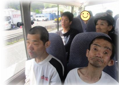
どこに行くのかな