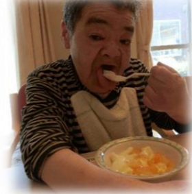
大きいお口でいただきまーす