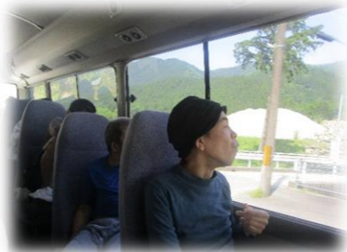
外の景色に夢中です