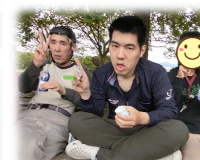
同じグループの仲間でピース