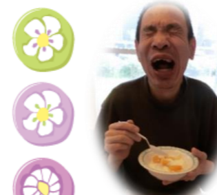
自然と笑みがこぼれます(^^)

5月17日にフルーツ寒天牛乳ゼリーを作られました。材料を混ぜたり、果物を器に入れたりされ、皆さん笑顔で楽しそうに取り組まれました。