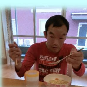
麺も上手に食べられます