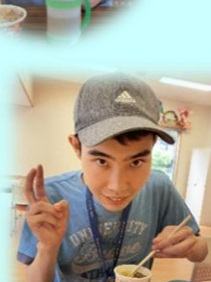
美味しくてピース！！